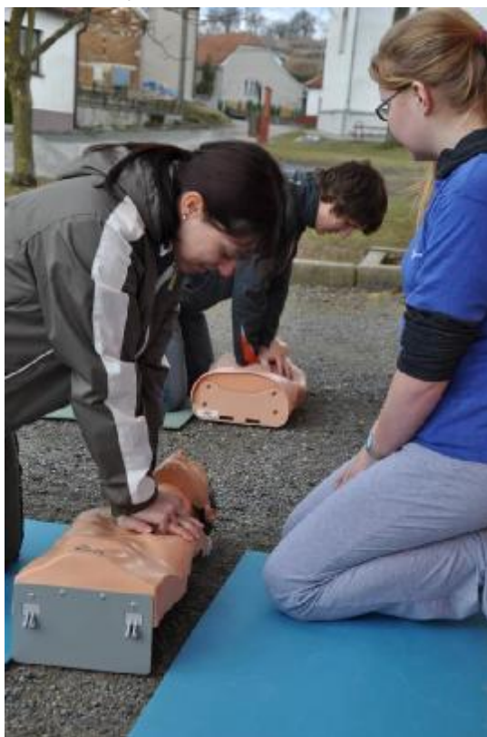
12. – 14. 4. 2013 Zážitková první pomoc