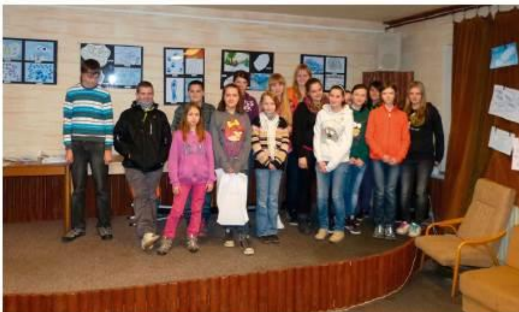
Ocenění účastníci výtvarné soutěže.