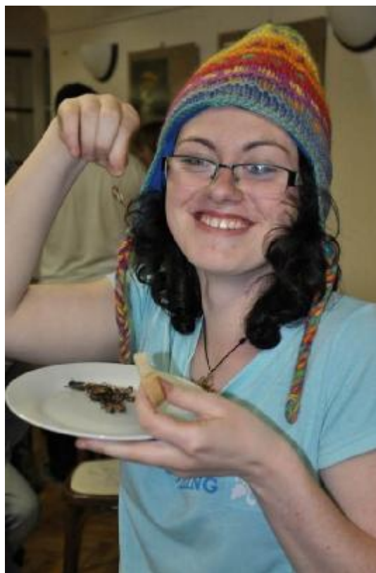
11. – 13. 10. 2013 Přežití (nejen) v přírodě