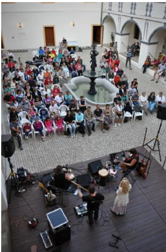
14. 8. 2013 Devítka