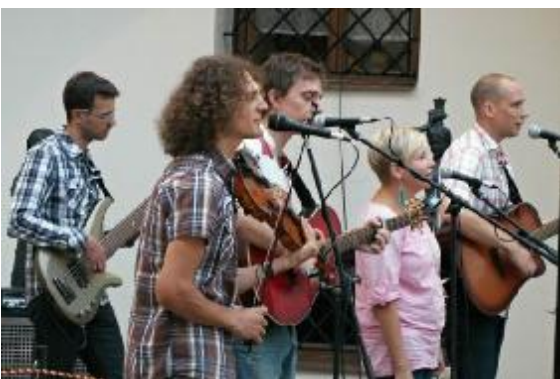
21.8.2013 Na větvi