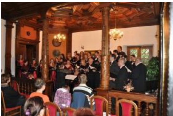
26. 6. 2013 Capella Polyphonica Salesiana