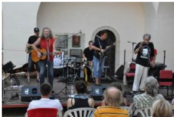
10. 7. 2013 Folk Team