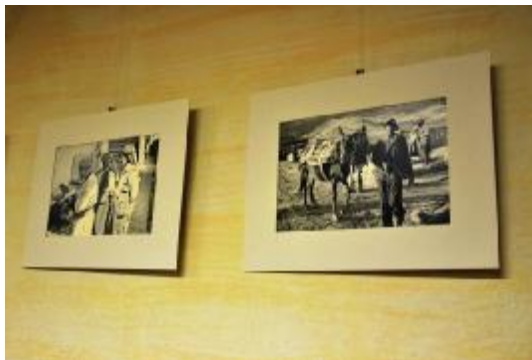
Výstava fotografa Iva Fleka (podzim 2013)