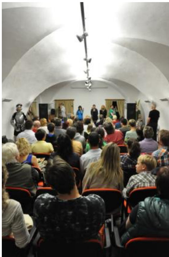
28. 8. 2013 Mošny